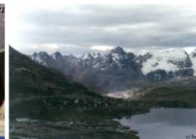
Consecuencias del Calentamiento Global en Huaraz