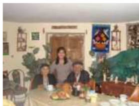
LA CHICA DE LA SEMANA

EPS Chavín S.A. Les desea Felices Fiestas y venturoso a 2012