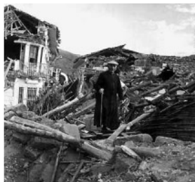
REMEMORANDO EL ALUVIÓN DEL 13 DE DICIEMBRE DE 1941