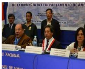
AUDIENCIA PUBLICA DE SEGURIDAD CIUDADANA SE LLEVO A CABO CON EN HUARAZ