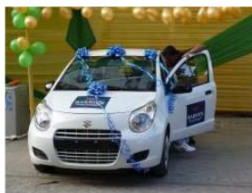
EL 18 ES LA RIFA DEL SPORT ANCASH